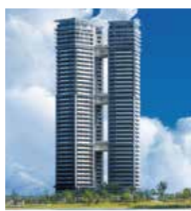
アイランドタワースカイクラブ (福岡市東区)

新栄グループは、1970年、新栄住宅株式会社の創業以来、福岡都市圏を中心に約9,800戸※の「アンピールマンション」の供給をはじめ、マンション、ビル、戸建てなどの管理、リフォーム、戸建て住宅、仲介・買取り再販、賃貸など、さまざまな事業を展開する総合不動産企業グループです。お客様の大切な資産運営をグループ各社の連携、ノウハウ、地元企業ネットワークを駆使してサポートいたします。 ※2022年4月現在（販売中物件を含む）